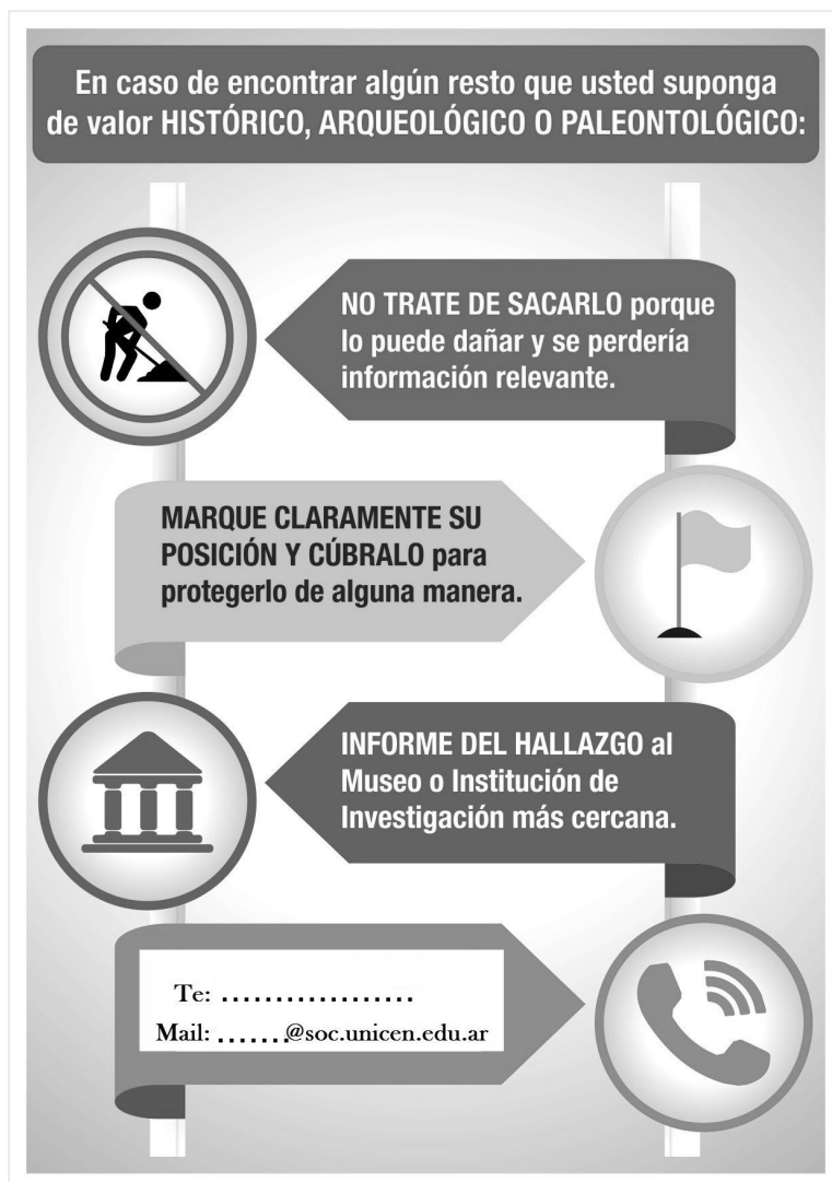
Figura 2. Ficha técnica de guía con la finalidad de difundir la protección del Patrimonio Histórico Arqueológico y Paleontológico de cada comunidad

En las últimas décadas el crecimiento económico de la ciudad se volcó al miniturismo natural y cultural, al mismo tiempo que se producía una disminución notable de la industria en general y especialmente la de la piedra. Esto se encuentra sujeto a la situación económica general del país, impactando las circunstancias económicas adversas de manera negativa en estas actividades. En agosto de 2016, a raíz de la necesidad de generar nuevas historias para el turismo local, resurge la incógnita