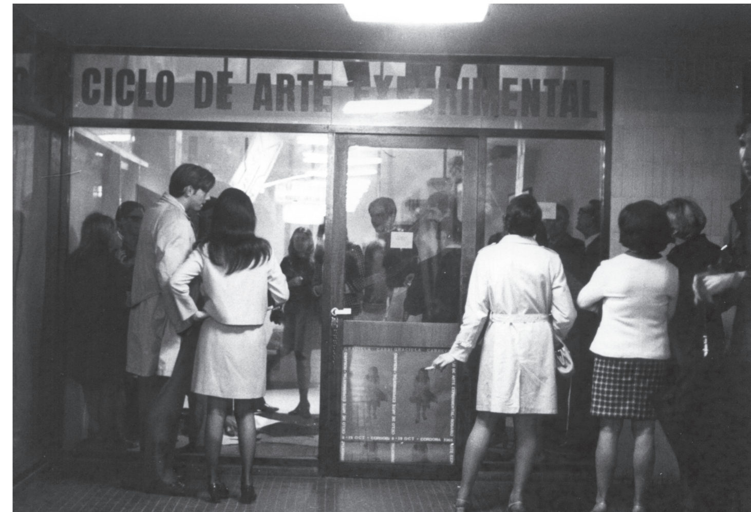
Fig. 05: Graciela Carnevale. El Encierro, acción. 1968.

(LUCERO, 2018c: 61). Desde el exterior un muchacho rompía el vidrio. Finalizada la obra (que dejó como consecuencia la rotura de los vidrios, resultado de la necesidad del público de salir del sitio que había sido cerrado con llave por Carnevale) los artistas debieron abandonar el local alquilado.