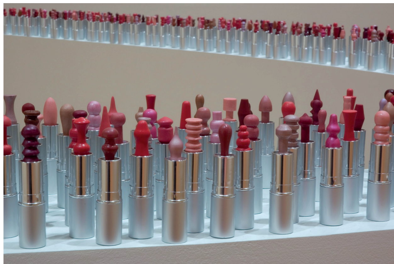
Fig. 08: Livia Marin. Ficciones de un uso. Instalación 2004.

sagración social. Livia Marin, radicada en Londres, ha trabajado con objetos de bajo costo y seriados que construyen instalaciones de grandes dimensiones. En Ficciones de un uso (2004) la artista esencializa los elementos básicos de la cosmética femenina como los pintalabios, y rearma un conjunto de unos dos mil quinientos objetos. (Figura 08) Cada pieza está coloreada por tonos diferentes, característicos de los muestrarios cromáticos que se ofrecen en los locales de venta de artículos de perfumería. La instalación en su totalidad plantea un borde entre el objeto trabajado e intervenido de modo peculiar y la producción industrial para consumo masivo. Cada cosmético, prolijamente torneado y terminado, se ofrece a la vista como promesa de belleza, atracción y brillo personal, aunque sabemos que se trata de ficciones. Se produce una paradoja entre el placer visual y la ineficacia estética de las pequeñas esculturas, abriendo un sentido reflexivo sobre los mandatos habituales dentro del universo femenino, los ecos sociales y políticos de las convenciones de la moda. En otro sentido, Marín recupera las configuraciones que identifican ciertos aspectos del mobiliario cotidiano, como manijas, adornos o distintos accesorios de madera, y los recontextualiza en esta enorme colección, disponible y atractiva.