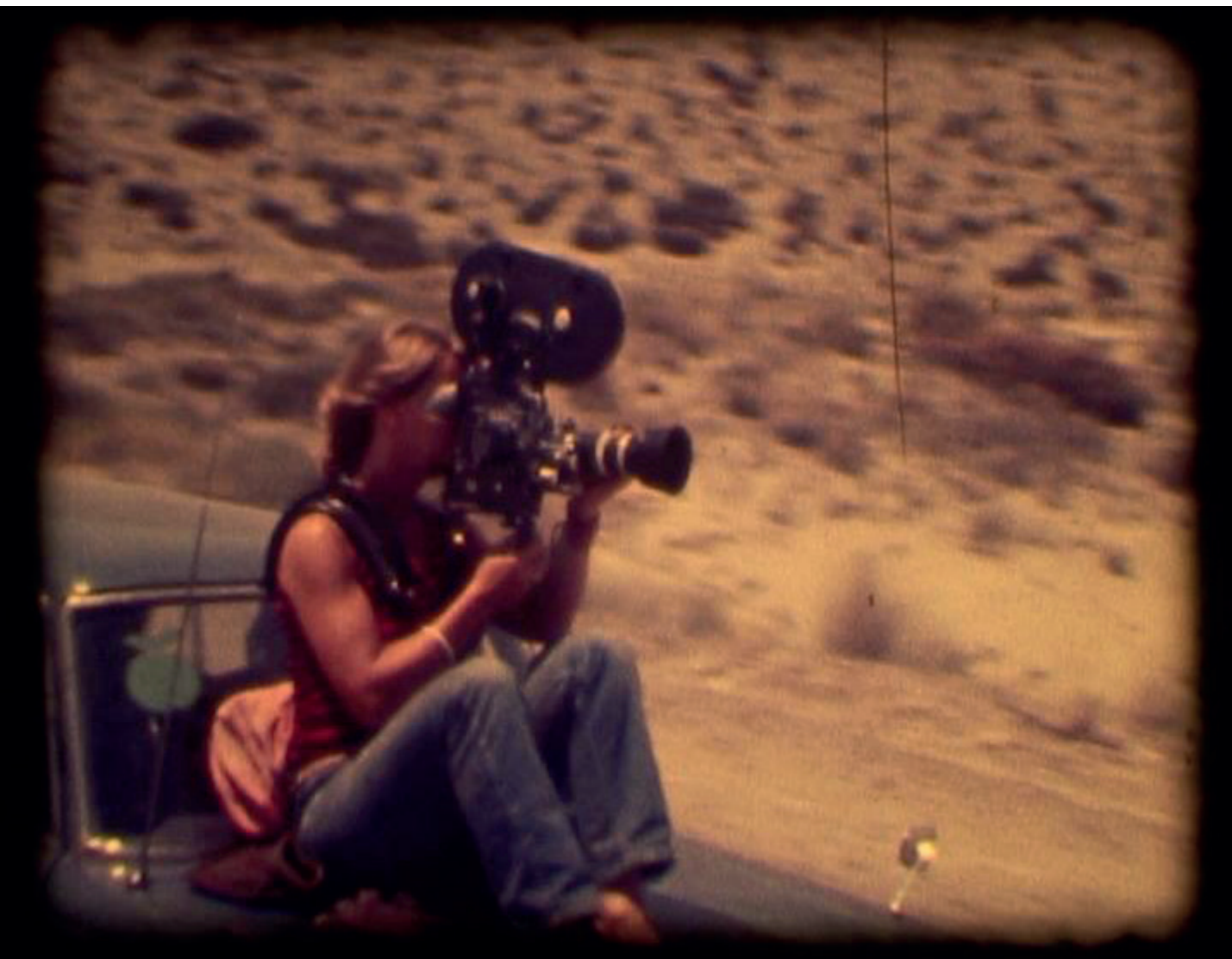
Fig. 01: Narcisa Hirsch. Fotograma del cortometraje Verano del 72. 1972.

Rostros en sombras, mujeres sonrientes y hasta un falso monje con capucha y un revólver ficticio que se detiene en la ruta y baila con desparpajo. Los desvíos de la escritura local aparecen en el frente de una vivienda, cuyo cartel reza BAR.Y.PENCION. La artista registra los lobos marinos a poca distancia, enfatizando sus orificios sexuales, las texturas de sus pieles, las poses lúdicas y el descanso de los animales al sol. Ovejas que son esquiladas, gallinas, barcos y primeros planos de la zona portuaria. Tres imágenes de la propia Narcisa Hirsch se destacan en este recorrido: de espaldas, desnuda en el mar, filmando desde el capó del auto (Figura 01) y su rostro de frente, al final del corto.