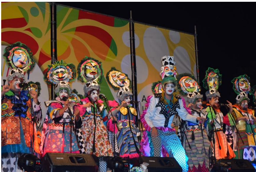
Imagen 3. La mojjigata , Tablado 1° de mayo. Montevideo, febrero de 2019.

Los espectáculos de murga están acompañados por el uso de un vestuario y maquillaje específicos, creados en función del tema del repertorio. Al ser uno de los rubros del concurso, las murgas tienen como parte de su staff personas encargadas del maquillaje y el vestuario, se trabaja para combinar ambos elementos en relación al tema del espectáculo y a la caracterización de los personajes. Existe una gran variedad de propuestas sobre ambos rubros, lo que se puede ver dentro del carnaval es la relevancia que se le da a cada uno de estos elementos, ya que cada año se profesionalizan más, se invierte mayor presupuesto y se otorgan menciones a mejor vestuario y maquillaje.