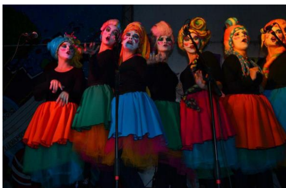
Imagen 20: Debut de Modestia aparte en SUM de la Facultad de Psicología, 9 de noviembre de 2012.