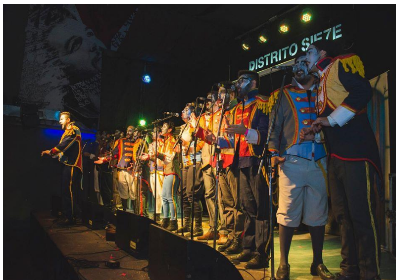
Imagen 16: “Próceres” en Distrito 7, 12 de diciembre de 2015. Fuente: Facebook de Los vecinos re contentos .

“Próceres (La Patria es el Orto)” en Distrito 7, que se convirtió en uno de los espacios más frecuentados por las murgas para hacer sus presentaciones. En ese mismo lugar grabaron el DVD el 1 de julio de 2016 y despidieron el espectáculo el 2 de diciembre de 2016.