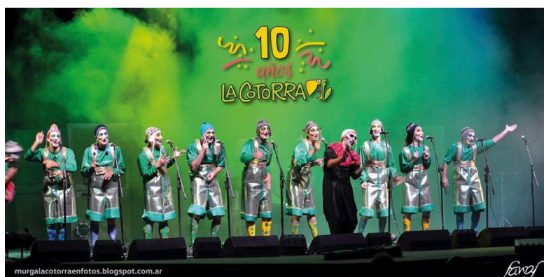
Imagen 9: La cotorra en el Teatro de Verano. Montevideo, 31 de enero de 2012.

Con la participación de la murga en el concurso del carnaval de Montevideo La cotorra se convirtió en el primer conjunto (y todavía el único) con todos integrantes argentinos en participar de esa fiesta popular 55 . Este hecho es muy significativo, ya que en Rosario se encuentra la única murga argentina que participó del carnaval de Montevideo y le dio visibilidad al género en la ciudad (mostrando Rosario en Montevideo y Montevideo en Rosario). En Montevideo fueron contratados e hicieron más de veinte tablados y hasta recibieron un homenaje 56 . Además, contribuyó a la popularización del género gracias a que la murga se hizo más conocida y comenzó a tener una mayor presencia en eventos culturales en diversas ciudades del país.