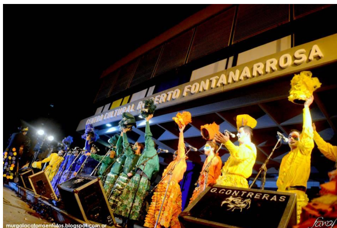
Imagen 8: presentación de “Cómodamente” en el 1er encuentro de murgas. Centro Cultural Roberto Fontanarrosa. 22 de marzo de 2014.

“Cómodamente” se estrenó el 8 de febrero de 2013 en la explanada del Museo Castagnino e inmediatamente comenzaron a realizar toques en la ciudad y a hacer giras por algunos carnavales del país, destacándose su participación en el Festival de Murgas del Carnaval de Venecia en el Delta (12 de febrero, Tigre) junto a Agarrate Catalina 52 .