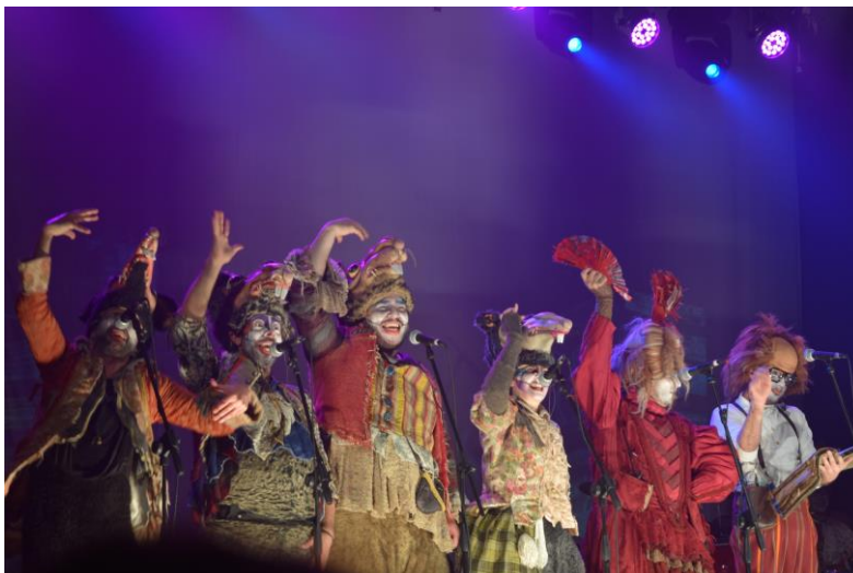
Imagen 2. presentación de “Un día de julio”, Agarrate Catalina . Teatro Mateo Booz, Rosario, 6 de octubre de 2017.

cualquier otro elemento o efecto utilizado en el espectáculo con el propósito de generar espacios y climas que contribuyan a transmitir lo deseado (2019).