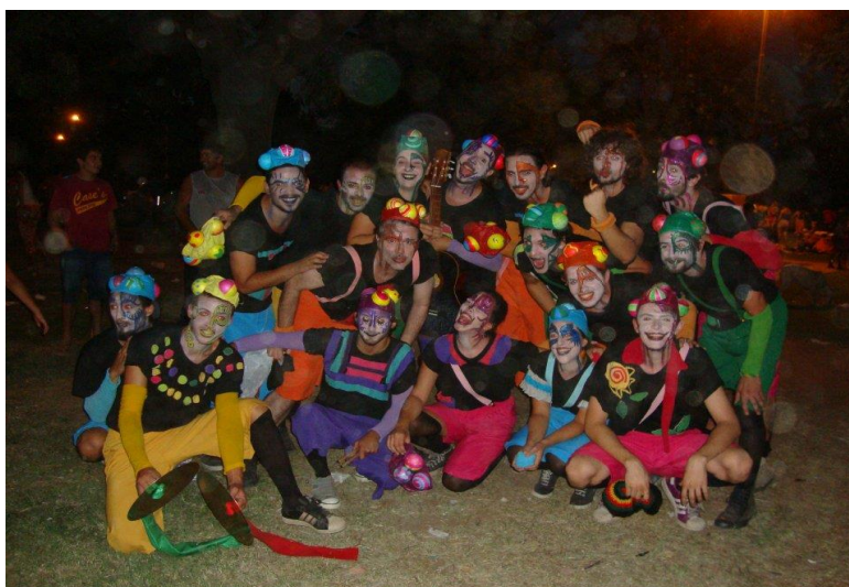
Imagen 14: “Todos somos Juan” en el Carnaval Cumple Pocho, 27 de febrero de 2012. Fuente: Facebook Los vecinos re contentos .

Ese antes y después de “Todos somos Juan” significó pensar en la profesionalización de la murga, en crear espectáculos que tuvieran mayor calidad artística en función de las letras, la musicalidad y la estética. Después de este primer espectáculo tomaron la decisión de mantener una producción más activa y generar un espectáculo cada año, lo que significó trabajar más por y para la murga, dedicarle más horas al ensayo, formarse a partir de talleres, organizar y dividir el trabajo, sumar más integrantes para diversos rubros como el de vestuario y maquillaje e invertir en la murga. Tal como relata Bortolotto: