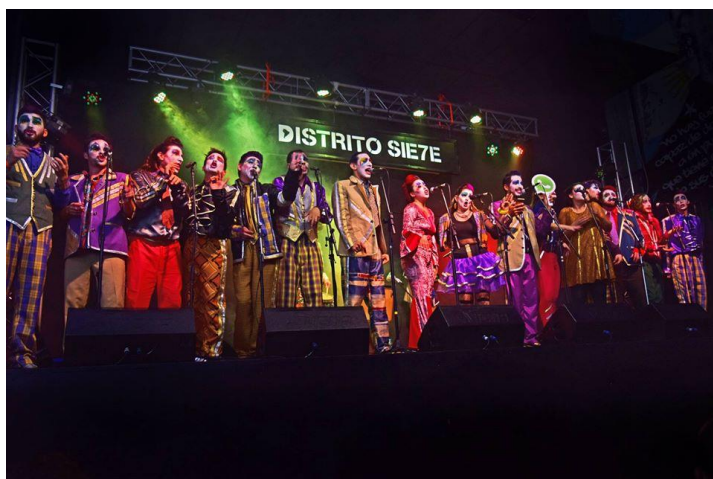
Imagen 19: La cotolengo , adelanto de “Solos y solas” en Distrito 7, 28 de septiembre de 2018.

La cotolengo , que no sé si lo tuvo el resto de las murgas que estaban hasta ese momento, capaz que las de ahora sí, fue que nosotros, la primera vez que actuamos ya actuamos con un espectáculo propio, vos lo escuchás ahora y decís “ay por dios”, pero las murgas que arrancaban por lo general, arrancaban haciendo covers, cantando canciones de murga (entrevista, 05/04/19).