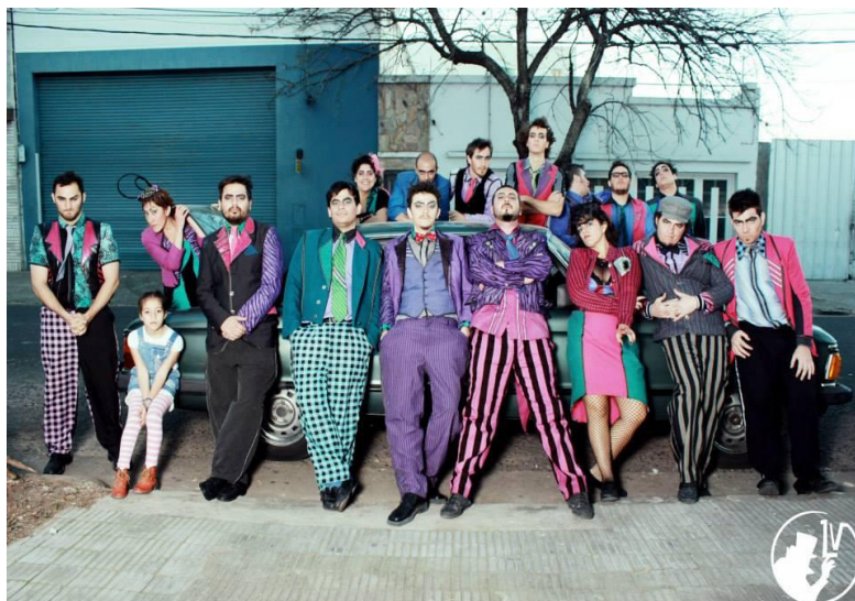
Imagen 17: Sesión de fotos de “Los villanos re contentos” (2014). Registro de Carolina Clérici. Fuente: Facebook de Los vecinos re contentos .

Los vecinos han sabido crecer como murga, lo que permitió también que evolucione el género en la ciudad. Comenzó con un rol y un interés más vinculado a lo social y lo político, pero supo, sin dejar ese principio de lado, darle otro sentido al aspecto artístico y crear espectáculos de calidad en los diferentes rubros que atañen al género. Bortolotto comenta: “Hoy por hoy sinceramente somos una murga del centro, que cantamos en lugares donde nuestro espectáculo se puede ver bien, y en algunas cuestiones ideológicas que no claudicamos jamás” (entrevista, 07/04/2019).