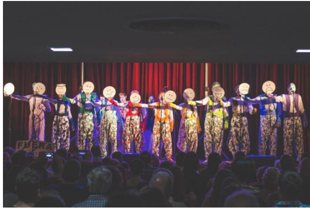
Imagen 22: Estreno de "¡Tal Cual! (que te recontra)" en Auditorio Grandoli, 2 de diciembre de 2016.

La marencoche empezó como taller en mayo de 2013 y si bien tuvo un comienzo más cercano a la perspectiva de hacer murga de La cotorra , ya que el taller lo facilitaba el director de esa murga, desde 2015 se sumó al Colectivo y comenzó a organizar su propio curso en diversos espacios públicos de la ciudad 77 y a participar de las actividades gestadas por el grupo. Ha presentado clásicos de murgas y fragmentos de espectáculos propios, sin embargo, fue un grupo que no llegó a consolidarse. En 2017 trataron de darle un nuevo rumbo a la murga al cambiar de nombre y elegir uno que incentivara el trabajo a realizar, Ponete las pilas , pero el proyecto no prosperó y se desintegró luego de la organización de su curso en 2018.