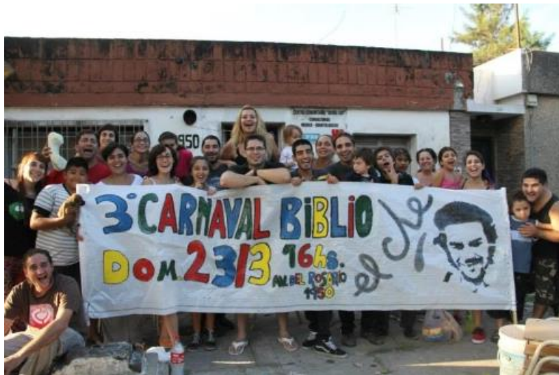
Imagen 29: Integrantes de La Guevarata y Biblioteca Popular “El Che” en la organización del 3er carnaval.

De mismo modo que Mal ejemplo con La Casita, crearon un vínculo con su lugar de ensayo, no sólo por la organización de su carnaval, sino por participar de diversas actividades organizadas allí. Pizzirusso cuenta que a partir de su pertenencia al barrio es que piensan el rol político la murga “nos sentimos identificados por ahí con las cosas que más nos afectan o a las cuales estamos más arraigados por ser parte de un barrio: ser parte de los reclamos populares o de los reclamos que sentimos por ahí cierta empatía” (entrevista, 9/07/19).