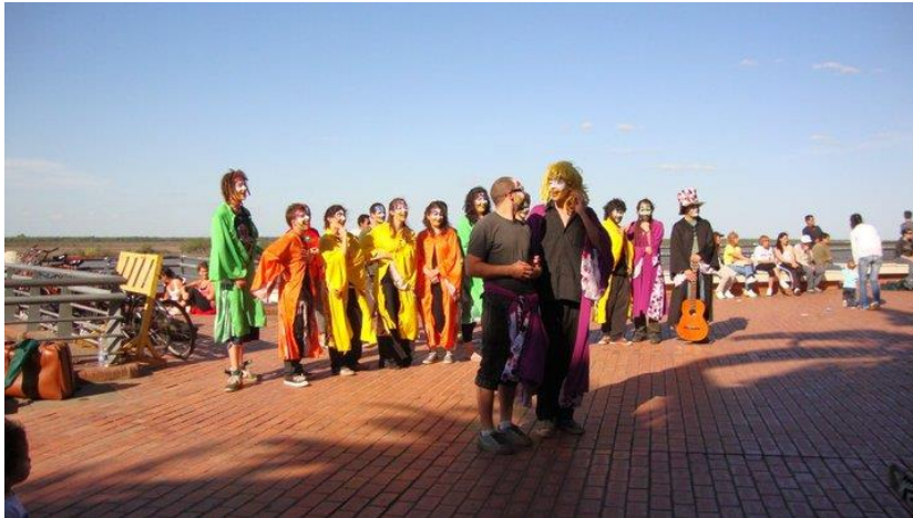
Imagen 11: toque de Mal ejemplo en escalinatas del Parque de España, septiembre de 2010.

género: optaron por salir a cantar a lugares públicos con toques, ensayos y gorras en Parque España, la calle Pellegrini, la peatonal Córdoba y otros espacios de fuerte circulación de gente; procuraron nuevos escenarios para que pudieran presentarse las murgas; apoyaron la gestación de nuevos proyectos de murgas, colaborando con sus presentaciones y construcciones colectivas; en sus primeras actuaciones presentaban y explicaban las características del género.