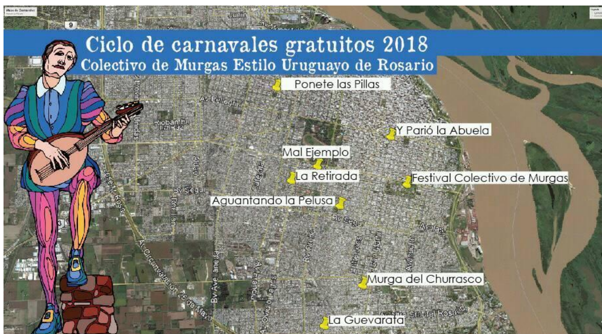
Imagen 30: Flyer de difusión de los carnavales organizados por el Colectivo en 2018.