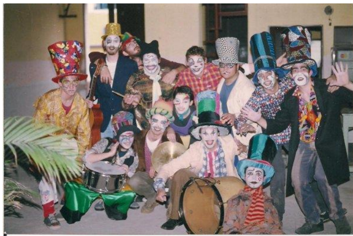
Imagen 4: Inicios de La improvisada (1999).

empezamos cantando clásicos y cosas por el estilo, muy mal, cantando muy mal, casi al unísono, los arreglos eran los que escuchábamos en casetes [...] después empezaron a llegar los videos, VHS obvio, de Contrafarsa y ese tipo de cosas y ahí empezamos a ver, 'ah, mirá tienen trajes' (entrevista, 14/07/2017).