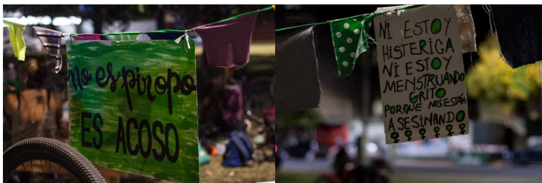
Imagen 32: Carteles en primer Carnaval de Herederas del pomo . Plaza Moreno, 30/ 03/ 2019.

lectura de un documento que se reproduce dos veces en cada curso para informar al público presente cómo accionar en caso de sufrir o presenciar actitudes sexistas. En el documento se lee su objetivo: “Presentamos este comunicado, con la intención de visibilizar y concientizar acerca de los acosos, abusos, violencias y problemáticas con las que nos encontramos cotidianamente las mujeres y disidencias” 114 . A esta acción se suma la difusión de carteles en el espacio público.