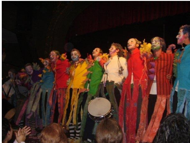
Imagen 5: Presentación de Mugasurga en Sala Lavardén, 2006.

vinculado a Uruguay. A partir de este grupo se sembró el primer germen por hacer MEU en y desde Rosario, desde su contexto social, político y cultural, lo que se hace visible hasta por la elección de su nombre: Mugasurga , que implica decir murga en el dialecto rosarigasino que popularizó el Negro Olmedo.