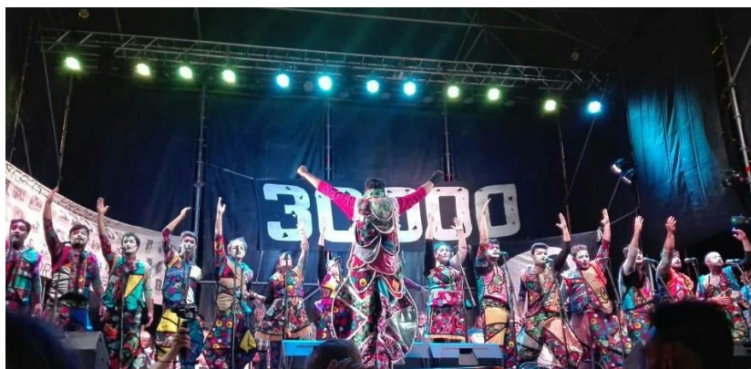
Imagen 31: Los vecinos en el acto del Día de la Memoria por la Verdad y Justicia, 24 de marzo de 2018.

De hecho todo el colectivo nos vamos a pintar la cara, como hicimos el año pasado para marchar y con esa pintura es la que vamos a ir a cantar. El año pasado nos hicimos unos pañuelos. Este año todavía no sabemos, pero vamos hacer algún diseño en relación al día y con eso vamos a ir después a cantar (Scherbovsky, 2017).