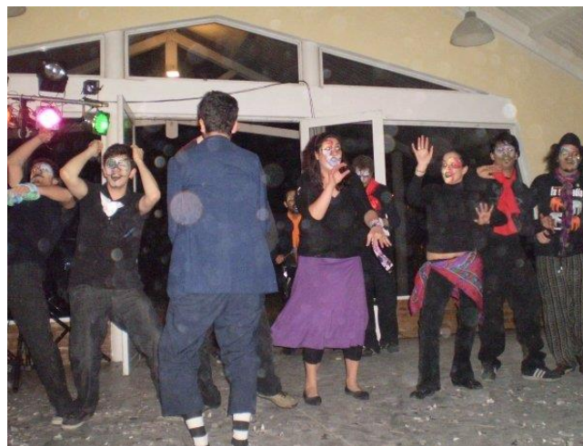
Imagen 13: Debut de Los vecinos , 5 de septiembre de 2010.

Comenzaron sus ensayos en 2009 en la casa de uno de los integrantes y luego de unos meses, el 5 de septiembre, tuvieron su debut en el cumpleaños de la madre de uno de ellos, donde cantaron una presentación propia, covers de Contrafarsa y La gran siete .