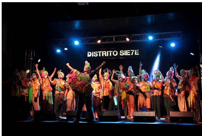
Imagen 28: Mal ejemplo en Distrito 7, 12 de febrero de 2018.

Compañeros de cueva, tomando en cuenta los últimos sucesos que han arribado a nuestra división, pregunto: ¿Qué tipo de sociedad debimos lograr construir y qué onda la zanja, la zanja de la humanidad? Nos ganó la arrogancia y el individualismo. Si es mucho más lindo armar, soñar entre todos, este carnaval (Mal ejemplo, 2017, 29m45s).