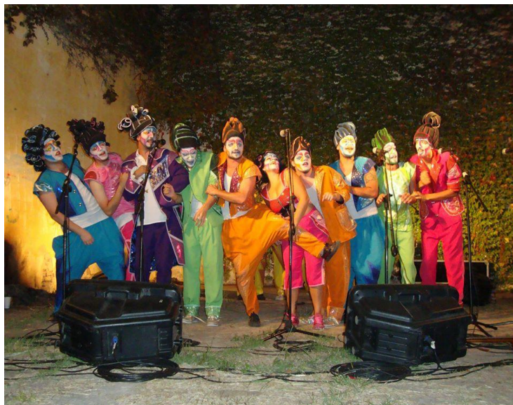
Imagen 15: “La fama cuesta” en Festival de murgas en la Casa del Estudiante de Medicina, 20 de abril de 2020.

A partir de este segundo espectáculo empezaron a fortalecer la estrategia de organizar fiestas con el fin de juntar el dinero para cumplir con los objetivos que se proponía la murga, entre las que se destaca la fiesta de disfraces realizada el 21 de septiembre en la escuela Almafuerde donde grabaron su nuevo DVD. Con este espectáculo también empezó a tener presencia en los medios, ya que algunos portales difundieron, en su sección de espectáculos, el accionar de la agrupación y también comenzaron a presentar sus espectáculos en Buenos Aires al establecer lazos con murgas de esa provincia 71 .