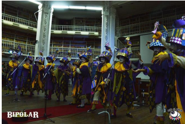
Imagen 24: Ojo al piojo en el cierre del 10° Encuentro de Coros, Biblioteca Argentina “Dr. Juan Álvarez” 14 de octubre de 2017.

Ojo al piojo es una murga que se caracteriza por extender los límites del género, por crear espectáculos que mezclan la murga con otras prácticas artísticas y pensar innovaciones a la forma típica de hacer murga. En un momento de su historia hasta llegaron a discutir la idea de transformar la murga en una compañía artística, pero se reafirmaron como murga después de la presentación de su segundo espectáculo.