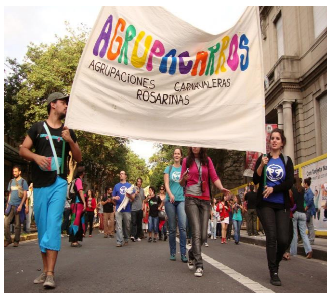
Imagen 26: Agrupacarros en la marcha del 24 de marzo.

En 2011, los vínculos entre las murgas se formalizaron bajo el nombre Agrupacarros [...] la agrupación se reunía una vez a la semana para coordinar la no superposición de cursos en época de carnaval, la negociación del tablado de carnaval organizado por la Municipalidad de Rosario en el anfiteatro municipal “Humberto de Nito” y la organización del Carnavalazo (Dayub, 2014: 29).