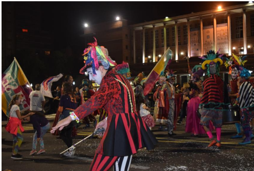
Imagen 1: Falta y resto en el desfile inaugural del carnaval de Montevideo, 25 de enero de 2018).

Yo soy la reina del bullying y me río del poder, lo hice por más de un siglo, lo puedo volver a hacer [...] soy propiedad de mi pueblo, soy capital de los pobres, soy una abuela, una niña, compañera, hermana, amiga, madre de todos los gritos, hija de la rebeldía (Falta y resto, 2018, 28m9s).