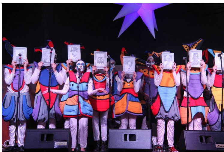
Imagen 10: Mal ejemplo en la Fiesta murguera del Club Social Canillitas, 21 de agosto de 2015.

Desde el año 2009 empezaron a llevar sus presentaciones a espacios como el “VI Encuentro Internacional de Murgas” de Concordia (2009) y en el “Encuentro de Murga joven” de Uruguay (2010), ya con la creación de algunas partes de un espectáculo propio con presentación, retirada, salpicón y el cuplé “El desfile de los candidatos”. En 2012 sumaron otro cuplé sobre la guerra del imperialismo que mantuvieron durante el año 2013 y al que adhirieron otro sobre la homosexualidad para conformar un primer espectáculo con la duración y partes habituales. Dado que Mal ejemplo no tenía en ese momento la dinámica de presentar un espectáculo completo en algún espacio específico, sus tiempos de trabajo y de producción se vinculaban al trabajo colectivo y a las necesidades e intereses del grupo.