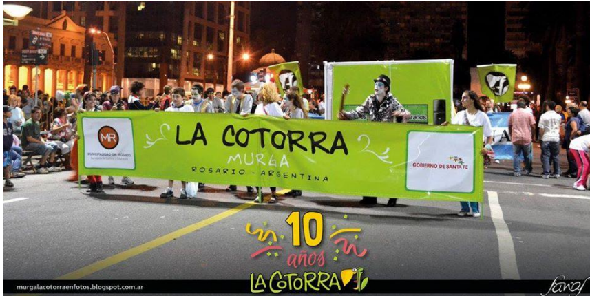
Imagen 7: Desfile inaugural del concurso de carnaval. Montevideo, 26 de enero de 2012.

A partir de su actuación en Montevideo, la popularidad y las presentaciones de La cotorra aumentaron significativamente, no sólo en Rosario y las ciudades aledañas, sino que comenzó a realizar presentaciones en diversas provincias argentinas, acompañó las presentaciones de las murgas uruguayas que actuaban en el país y se configuró como un referente del género a nivel nacional. Según sostiene Zalaba: