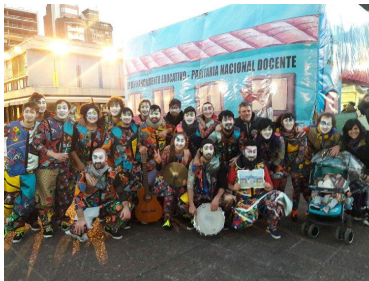
Imagen 33: Los vecinos antes de actuar en la Escuela Itinerante. Rosario, 18 de junio de 2017.

presentaciones más relevantes. Los vecinos y La cotelengo se presentaron en el contexto de la Escuela Pública Itinerante, una modalidad de reclamo que adoptó la Confederación de Trabajadores de la Educación para hacer público su pedido por la paritaria nacional docente y una nueva ley de financiamiento educativo 119 . La Guevarata , Y parió la abuela y Mal ejemplo se han presentado en clases públicas llevadas a cabo como forma de reclamo por mejoras de las condiciones de educación pública universitaria 120 . Los grillos del bidet y La cotorra actuaron en festivales y jornadas de defensa de la educación pública.