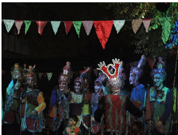
Imagen 12: Toque de La pelusa en el curso de Sobretudo en verano , Centro Cultural La Angostura, 3 de abril de 2014.

Lo que caracterizó a La pelusa , hecho que se profundizó en los últimos años de existencia, fue la imposibilidad de mantener un grupo estable de integrantes, y esto dificultó crear nuevos espectáculos y mantener el espacio del ensayo. Con posterioridad al espectáculo presentado en 2013 no volvieron a crear un espectáculo completo, sino fragmentos que presentaban en los espacios de los corsos y carnavales organizados en la ciudad. La murga tomó la decisión de disolverse luego de la organización de los carnavales del Colectivo de 2019.