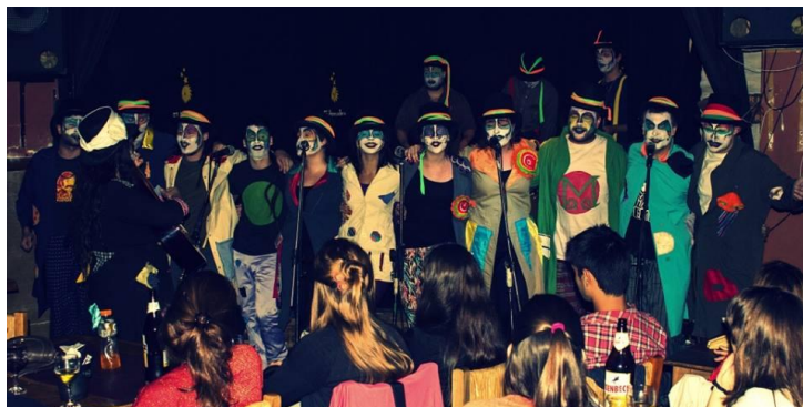
Imagen 21: Sobretudo en verano en El Aserradero, 24 de octubre de 2013.

del 2018, al poco tiempo de presentar su último espectáculo: “El lechón (vinimos por el choripán)”.