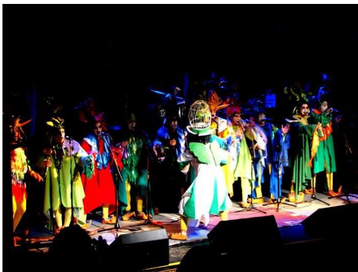
Imagen 6: presentación de “Uy, Uy, Uy! en Willie Dixon. 4 de diciembre de 2010.

Es importante pensar en ese proceso de constitución de la murga, ya que nació con un grupo de integrantes que participaron de una agrupación anterior que había realizado un espectáculo completo del género, lo que permitió la continuidad de una forma de trabajo y no fue necesaria una formación inicial 44 . Esto permitió que los tiempos para constituir y crear sus espectáculos fueran menores. Al año siguiente de su conformación iniciaron sus presentaciones en la ciudad cantando covers de murga 45 y en junio 2009 ya estrenaron su primer espectáculo completo: “Uy, Uy, Uy! Postales de la ciudad”.