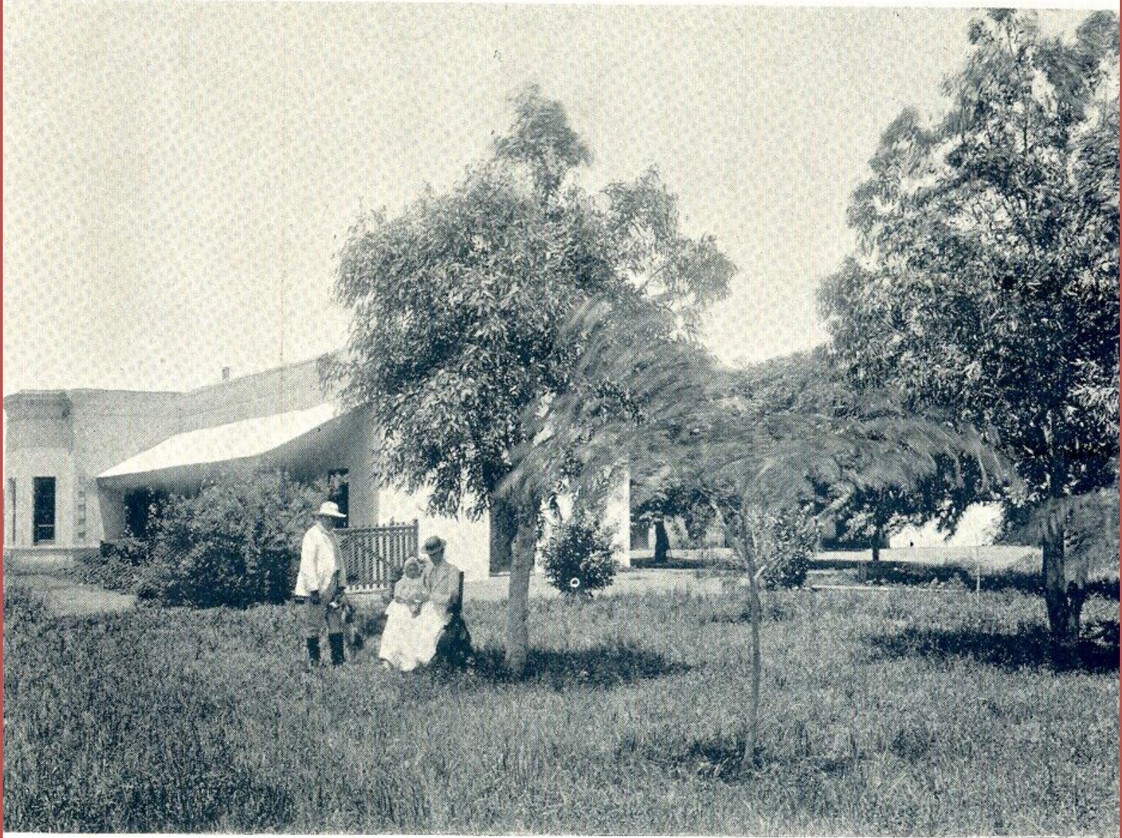
Estancia «Durham», de la Compañía Inglesa Limitada (Labordeboy, F. C. C. A )