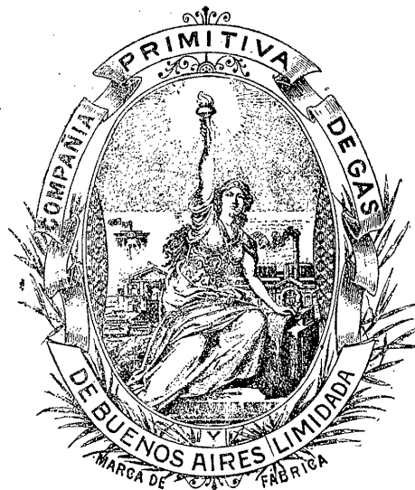
Figura 2. Logo de la Compañía Primitiva de Gas de Buenos Aires, Lda.

El espíritu del nuevo convenio y los objetivos del municipio quedan explicitados en el mensaje del intendente Manuel Güiraldes al Concejo para la aprobación del mismo. Como primer elemento destaca que la fusión de las empresas y la fijación de las tarifas máximas dará mayor protección a los consumidores particulares, una cuestión que, como vimos, venía sin resolución desde 1890. Allí también se explicaba que la fusión de las empresas de gas estaba orientada a que pudiesen competir con la empresa de electricidad y así beneficiar a los consumidores. 78