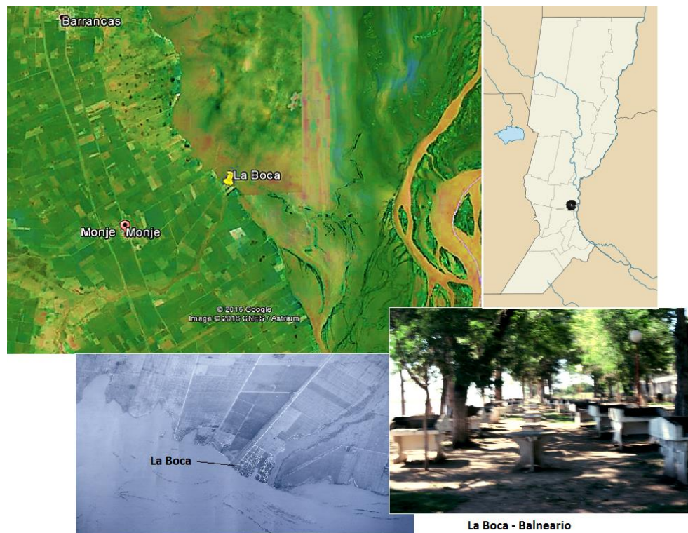
Figura 1. Ubicación San Bartolomé - La Boca

propietario ausente. No es seguro que el fraile permaneciera en esta pequeña misión un tiempo prolongado.