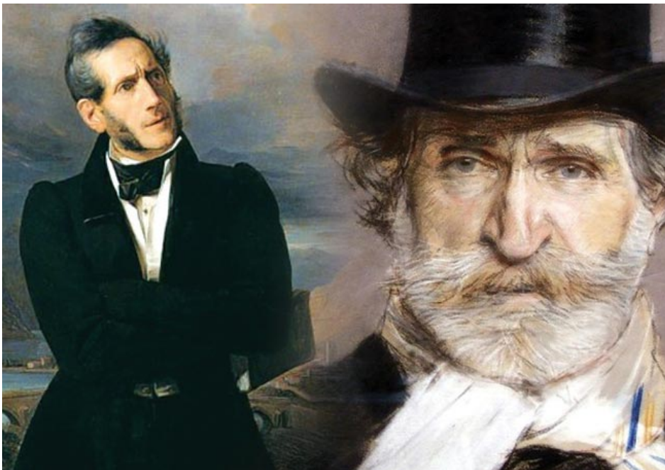
Autor/a: Dr. Oscar Bottasso

La historia de la Medicina, tan abundante en padecimientos que han convulsionado a la humanidad desde tiempos inmemoriales, escribe hoy una nueva página de alcance planetario y que de alguna manera nos enrostra esa otra faceta burda de la globalización. Al son del COVID19 danzamos y su coreografía nos retrotrae, entre tantas anécdotas, a sucesos no menos dolorosos como los ocurridos en la península itálica a comienzos del siglo XVII, que fueran palmariamente retratados por uno de los literatos más eximios de lengua del Dante, Alessandro Manzoni. Sin lugar a duda, un fiel representante del risorgimento que reunía a actores claves de la sociedad italiana, entre los cuales se destacaban él mismo, Giuseppe Verdi y por supuesto su gran artífice Giuseppe Mazzini. La meta era lograr una Italia unida e independiente fiel a su historia y geografía.