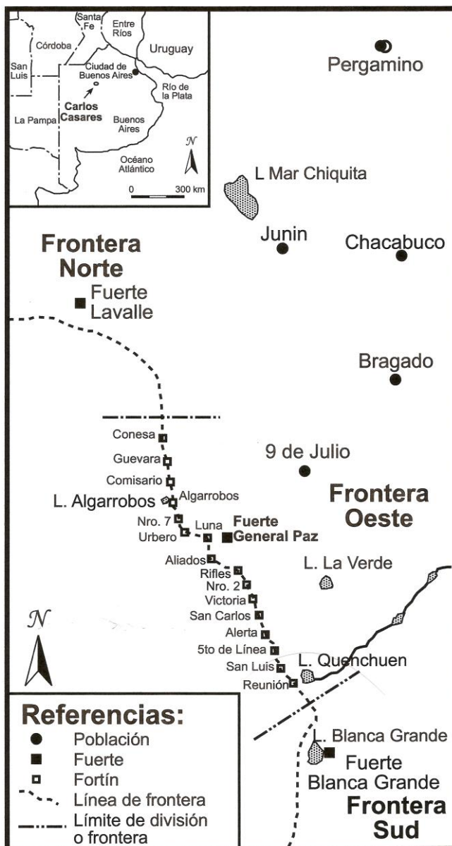
Figura 1. Mapa de la Frontera Oeste de Buenos Aires (redibujado a partir de Raone, 1969), mostrando ubicación del Fortín Algarrobos

cado entre ellos (actividad que se conocía como la “descubierta”) y elevar partes a la comandancia con las novedades. La señal de alarma ante invasiones indígenas consistía en disparar cuatro cañonazos si la invasión era por la derecha y tres si la invasión venía por la izquierda. El Fortín Aliados retransmitía la señal al Fuerte General Paz, donde el comandante de frontera organizaba la respuesta militar a la incursión (MGM, 1870:274-277).