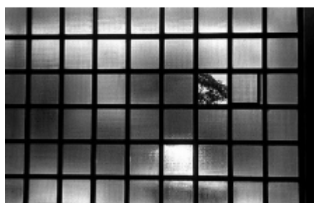
Fotografía de Adriana Lestido, de la serie "Mujeres presas"