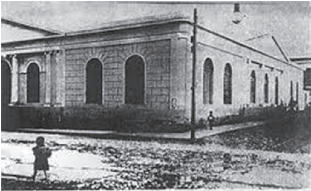
Figura 3. Escuela Normal Clara J. Armstrong. Foto de 1890 tomando la intersección de las calles San Martín y Salta.