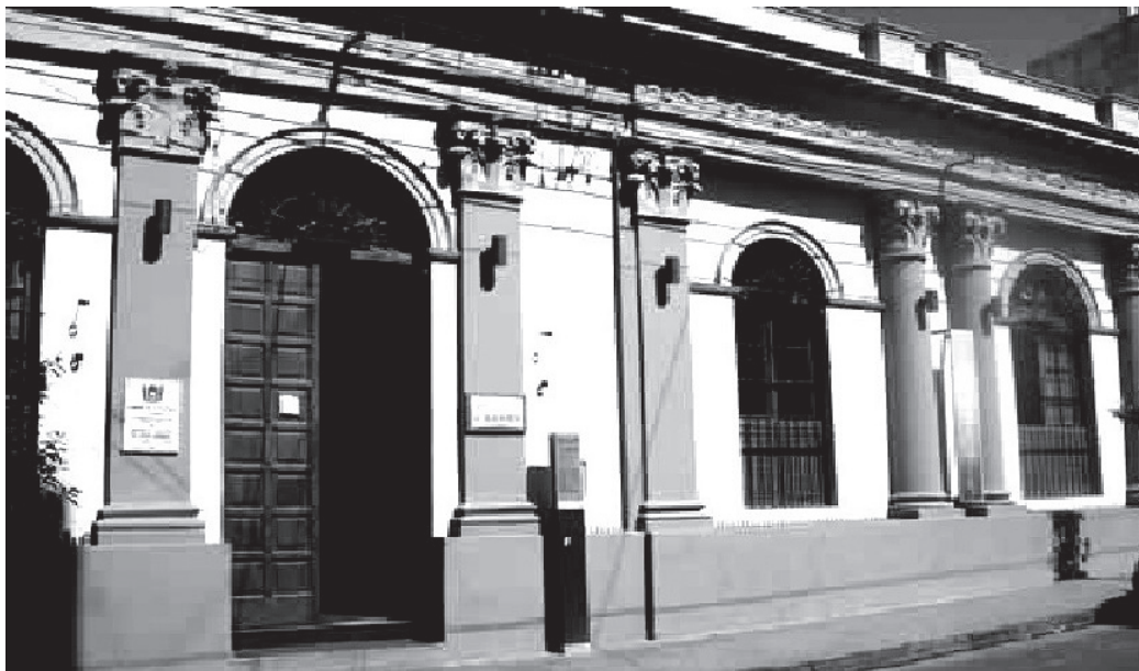
Figura 4. Actual biblioteca Julio Herrera (ex Escuela de Varones).

tónicas una práctica por parte del Estado Nacional; actuaron y actúan como símbolos de integración social en cuanto instrumento de conocimiento y de comunicación. Ellos hacen posible el consenso sobre el sentido de lo comunitario, contribuyendo a la reproducción del orden social que ayuda a construir y reconstituir las condiciones de dominación para que eventos o hechos materiales e ideales se plasmen en la realidad cotidiana de las personas.