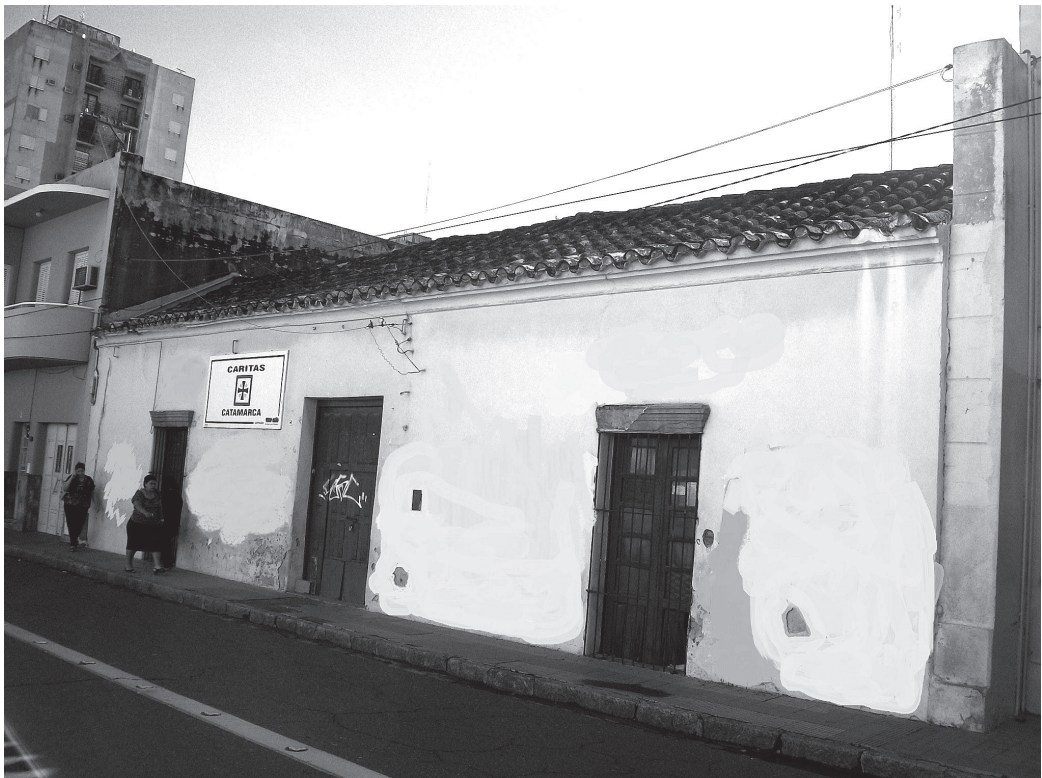
Figura 5. Casa refuncionalizada donde actualmente funciona Caritas Catamarca, ubicada en el cuartel primero de la ciudad de Catamarca.

gentina registrada en los Censos Nacionales, toda la población es argentina o extranjera; en ningún momento se alude a cuestiones raciales o fenotípicas claras. En el caso particular de la ciudad de Catamarca, el primer Censo Nacional admitía en su introducción histórico-social que "la población original de la misma resulta de la mezcla de los conquistadores españoles con los indígenas, al presente la raza indígena ha desaparecido casi del todo, como ha desaparecido el uso de su lengua" (De La Fuente 1872:480).