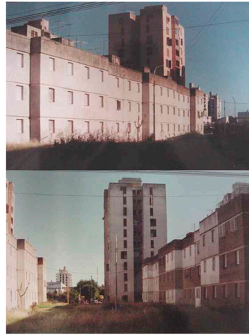
Estado del Conjunto Habitacional Grandoli y Gutiérrez previo a los planes de mejoramiento.