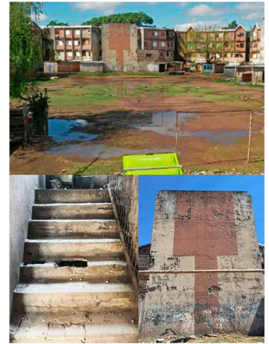
Estado del Conjunto Habitacional Seguí y Rouillón previo a los planes de mejoramiento.