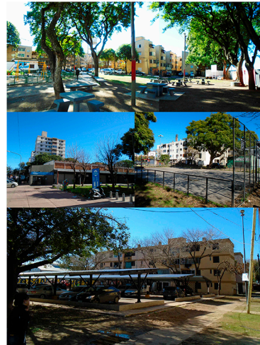
Estado del Conjunto Grandoli y Gutiérrez previo a los planes de mejoramiento.