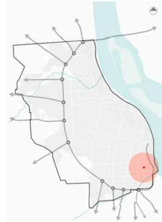
Fig.1: Ubicación Conjunto Habitacional Grandoli y Gutiérrez.