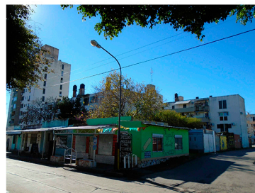
Problemáticas aún vigentes: usurpación de espacios comunes.

4) Seguridad y promoción social: En Grandoli y Gutiérrez se organiza "Unidad de Reducción de Violencia". También se establece vínculo con el programa Nueva Oportunidad como herramienta de inclusión laboral para jóvenes en riesgo. Vecinos perciben descenso en niveles de violencia, aunque persisten hechos delictivos, especialmente aquellos vinculados a las bandas de narcomenudeo. En Seguí y Rouillón se promueve el diseño participativo, la interacción de escuela y vecinos. Se evidencian aun situaciones de violencia y amenaza de usurpación relacionadas con grupos que no viven en el barrio.