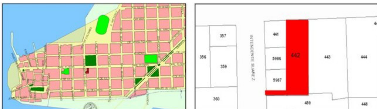
Figura 5. En color más oscuro y en forma de L inversa se limita el área del padrón n° 442.

360, entre las calles Lavalleja e Intendente Suárez. El terreno posee un área de 409 m 2 , de los cuales 329 m 2 están construidos.