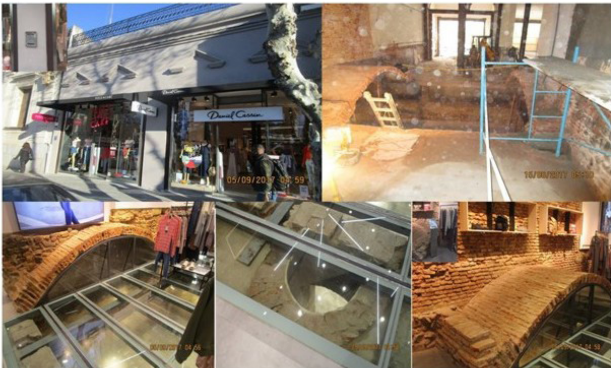
Figura 7. Trascuro desde el inicio hasta el final de la puesta en valor de la estructura.