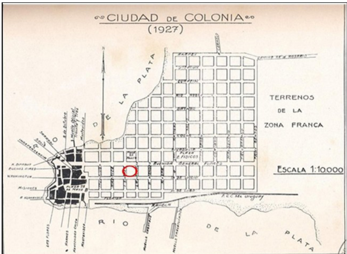
Figura 3. Plano de 1927. Extraído de Capurro (1928:96). Con el círculo se marca la manzana n°18.

Se puede observar como en este caso el padrón n° 442 se ubica en la misma manzana, pero ésta, cambia la numeración a 18. Recordando que fue a Quevedo, Larravide y Fongivell a quienes se les otorgó solares en las manzanas 17 y 18. Para este momento se amplía la avenida General Flores que de 20 varas de ancho pasa a tener 30. En 1883 se concreta la idea de creación de una plaza. El ensanche de General Flores indicado para 1867 se realiza en dos etapas posteriores en 1912 y 1920; dividiendo en dos la unidad del Casco Histórico de Colonia del Sacramento (Figura 3).