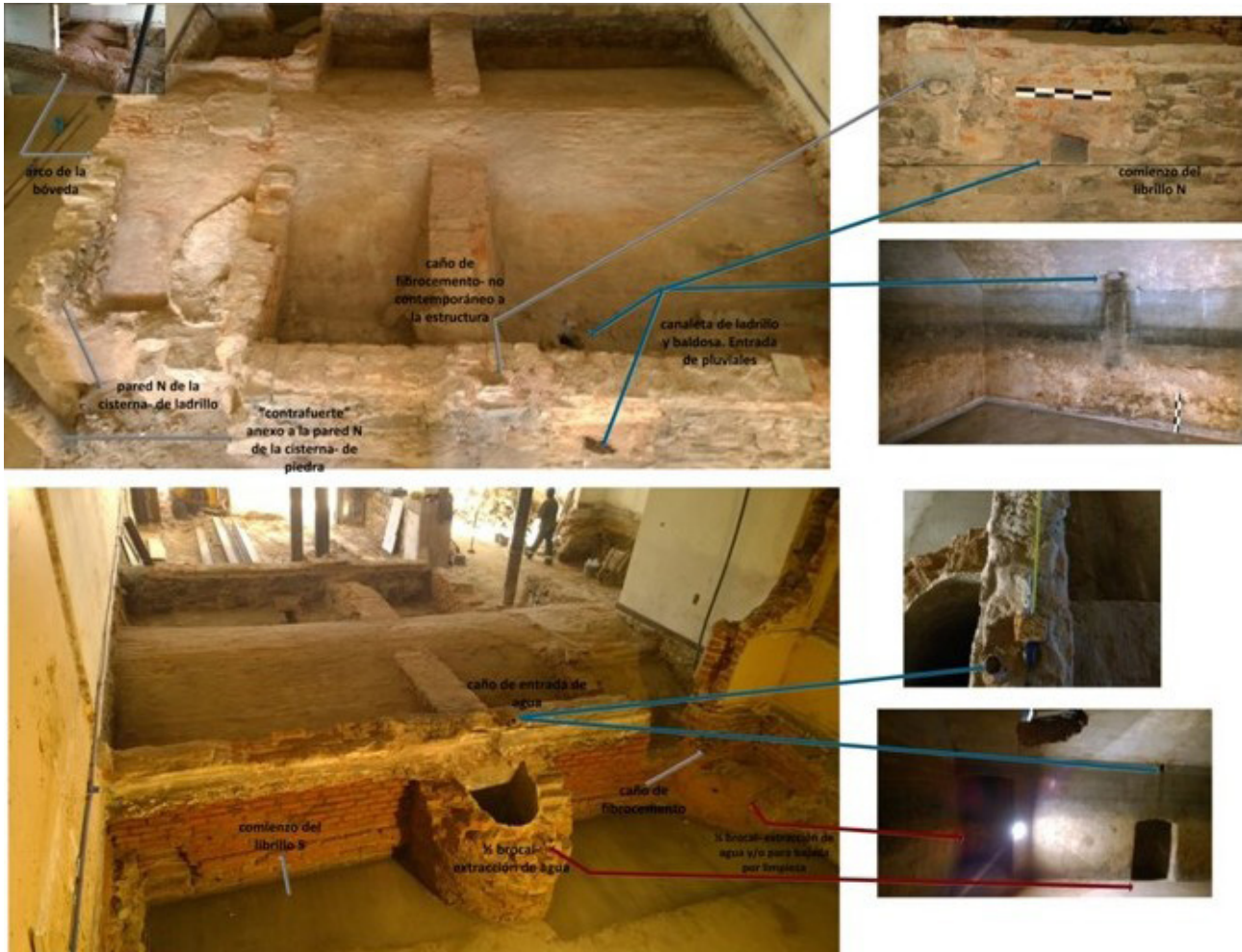
Figura 6. Vista la bóveda de la cisterna y del muro Sur con brocal. Con referencias y señalamiento a las entradas y anexos para la extracción de agua.

Sobre esta misma pared se halla una abertura que corresponde a la bajada del ½ brocal y otra sobre la esquina Sur-Este; desde el exterior se presenta como ¼ de brocal.