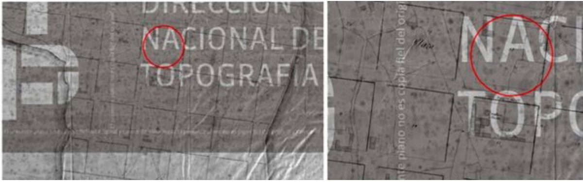
Figura 2: Plano Catastral de la Nueva y Vieja Ciudad de la Colonia del Sacramento. Registrado por P. Santías 1871. Ministerio de Transporte y Obras Públicas. El círculo marca la manzana donde se ubica el padrón 442.

Se puede observar como en este caso el padrón n° 442 se ubica en la misma manzana, pero ésta, cambia la numeración a 18. Recordando que fue a Quevedo, Larravide y Fongivell a quienes se les otorgó solares en las manzanas 17 y 18. Para este momento se amplía la avenida General Flores que de 20 varas de ancho pasa a tener 30. En 1883 se concreta la idea de creación de una plaza. El ensanche de General Flores indicado para 1867 se realiza en dos etapas posteriores en 1912 y 1920; dividiendo en dos la unidad del Casco Histórico de Colonia del Sacramento (Figura 3).