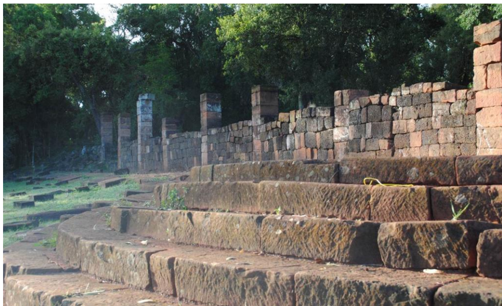
Figura 1: Fachada del claustro de la Reducción de Santa Ana (Misiones).