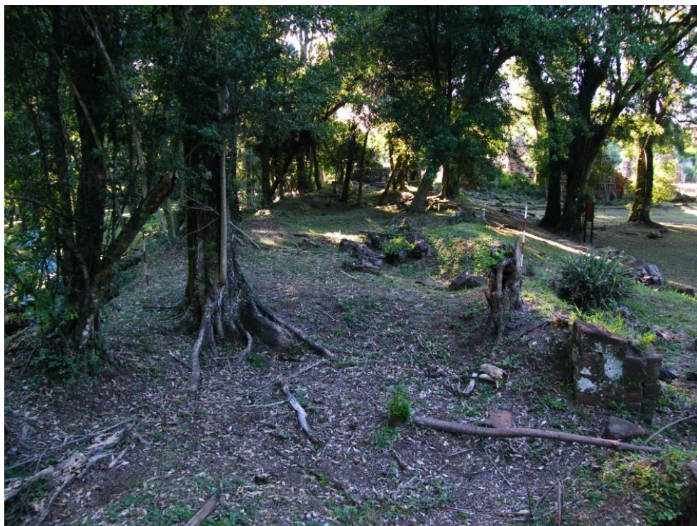
Figura 2: Vista general del ala E-W del claustro desde el interior de uno de sus recintos. A la derecha se observa uno de los vanos. Más atrás, el primer patio.