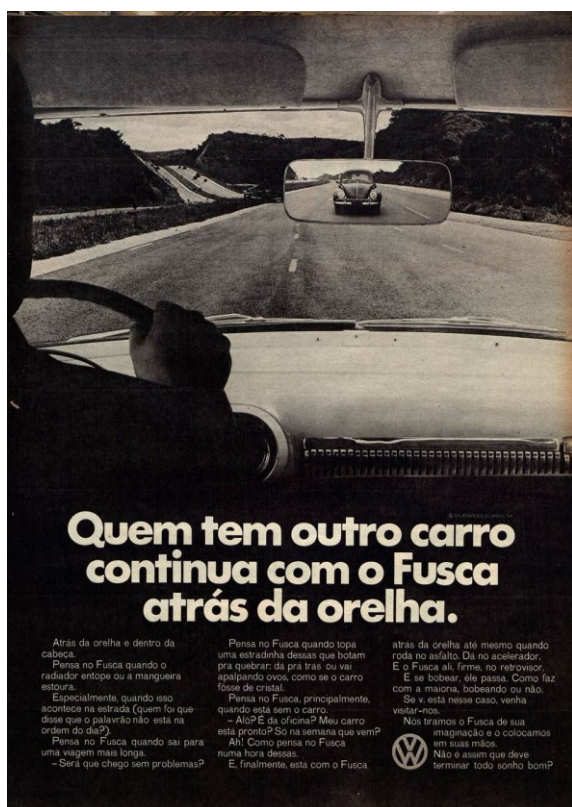
Figura 4 – Fusca