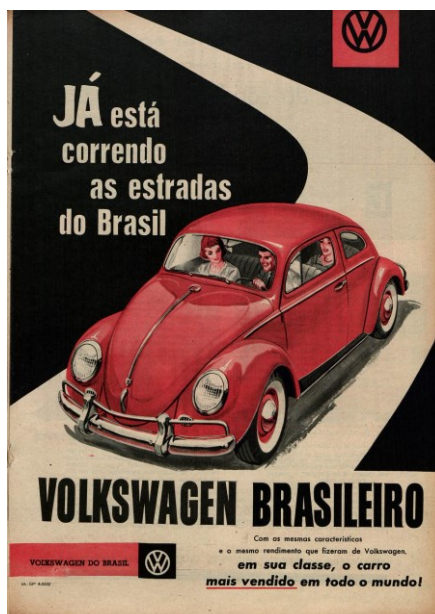
Figura 3 – Volkswagen Brasileiro

Em janeiro de 1959, pela primeira vez a Volkswagen do Brasil lança em diversas revistas uma única publicidade anunciando a chegada do “Volkswagen Brasileiro” (figura 3).