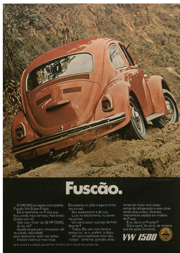
Figura 5 – Fusção