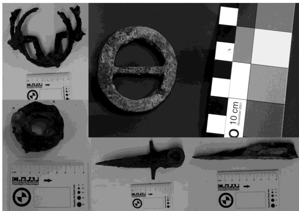
Figura 2. Elementos metálicos recuperados en la cuadrícula 6 del sitio Gascón 1

indígena de Gascón 1, se puede relacionar con aquella recuperada en sitios post-contacto del norte de la provincia del Neuquén (Hadjuk, 1991) y en sitios “araucanizados” de la Región Pampeana (Mazzanti, 1999). Con respecto a la práctica de la deformación artificial craneana en forma tabular erecta de los individuos de Gascón, es comparable a otras muestras correspondientes al Holoceno tardío final (ca. 2.000a 400 años AP), entre las cuáles pueden mencionarse Laguna Los Chilenos, Napostá, La Petrona (Barrientos, 2001; Martínez y Figuerero Torres, 2000). Sin embargo, la forma de los dientes incisivos en pala y doble pala, revelan diferencias con las poblaciones estudiadas del Holoceno tardío final, ya que en el área este rasgo se encuentra ausente (Oliva et al. , 2007).