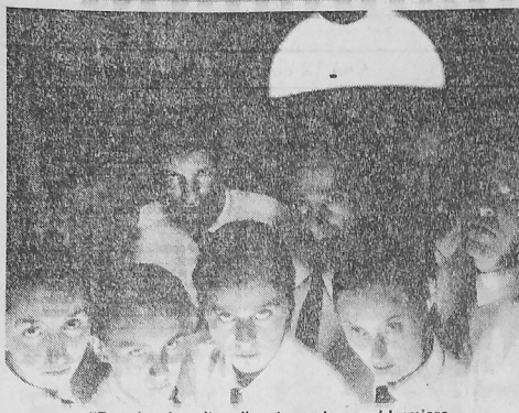
"Boogie, el aceitoso", esta noche en el Lumiere