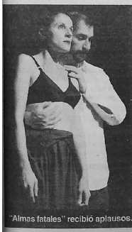
"Almas fatales" recibió aplausos.