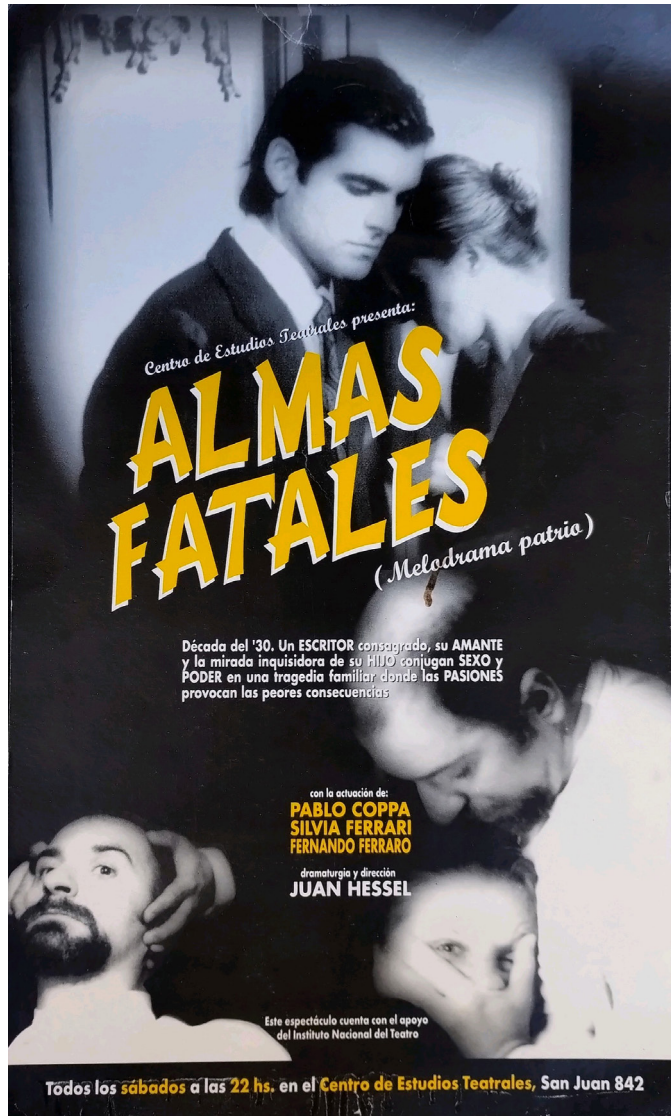
Almas Fatales afiche.