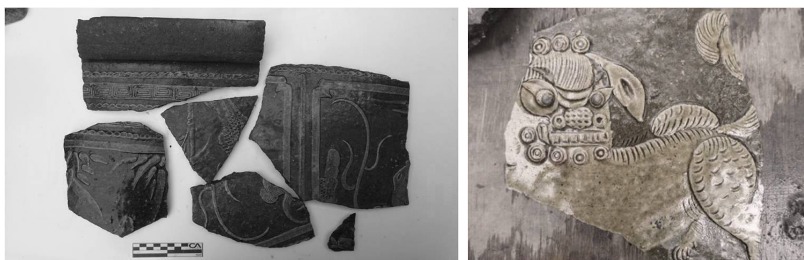
Figura 3: Posible cantero o macetón con motivos orientales y guardas griegas

Entre los objetos de uso doméstico, se destacan recipientes de loza con decoraciones impresas propios de la segunda parte del siglo XIX y primeras décadas del siglo XX, y restos de lo que podría ser un cantero cerámico de aproximadamente un metro de diámetro, el cual ofrece un sincretismo entre motivos figurativos orientales en el cuerpo de la estructura, sobresaliendo perros de Foo, aves y plantas por un lado, y trazos geométricos en todo su contorno cercano a la boca de la misma, asociados a la tradición griega entre el 900 y el 700 AC (Período geométrico). Todo el conjunto combinado en coloraciones amarillo-verdosas. Su cronología puede estimarse entre fines del 1800 y principios del siglo XX (Figura 3).