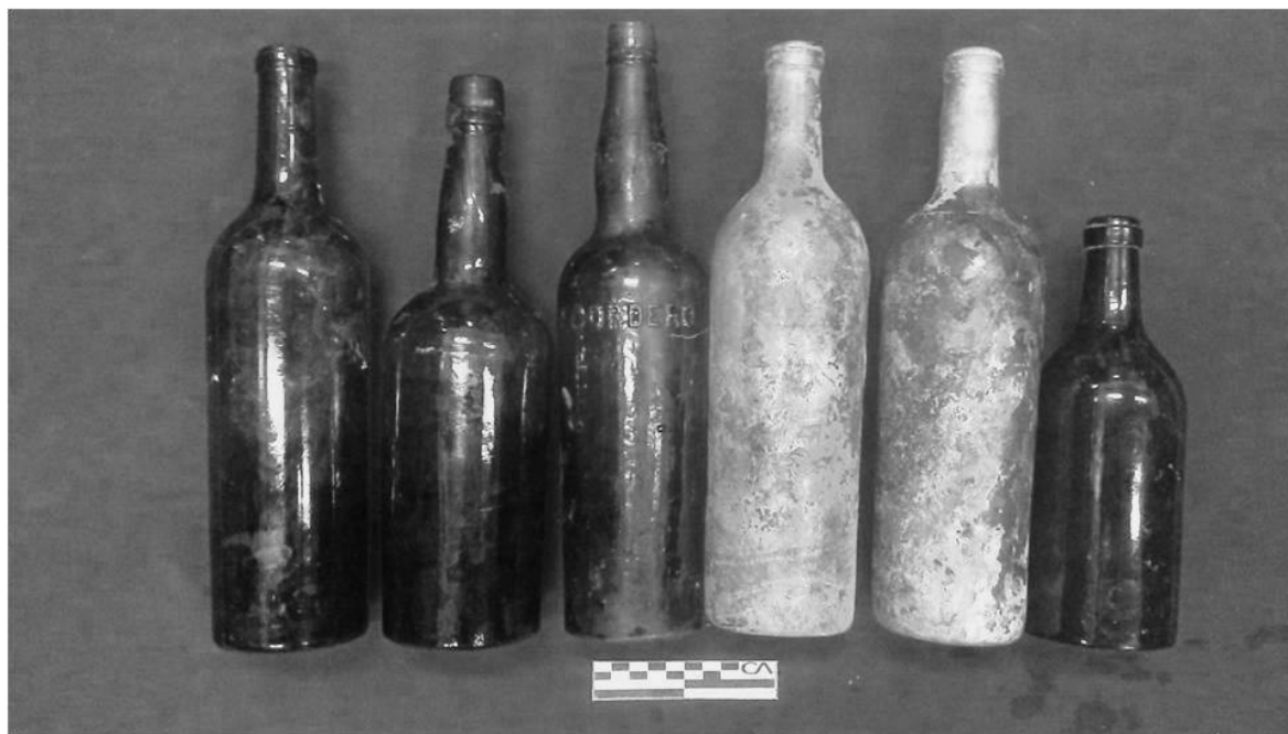
Figura 4: Botellas de vidrio de diferentes tipos de bebida. Fines siglo XX - principios siglo XX

Pueden apreciarse entre las mismas, una de agua mineral marca Krondorf. Estas botellas son cilíndricas, de color verde oscuro (aunque no tanto como las tradicionales de vino producidas en Inglaterra) y con pico redondeado, para poder ser bebidas sin vaso, directo desde la botella. La marca estaba impresa en relieve en la base con la inscripción para nuestro país de Julio Kristufek, su importador y a quien se le hacían las botellas especialmente, abajo decía Buenos Aires ya con “i” latina (pos 1900-10) y en el centro la marca Krondorf, todo en letras de imprenta de igual tamaño (Schávelzon, 2005). También se identificó una botella de vino de Francisco Cordero, muy difundido durante las primeras décadas del Siglo XX.