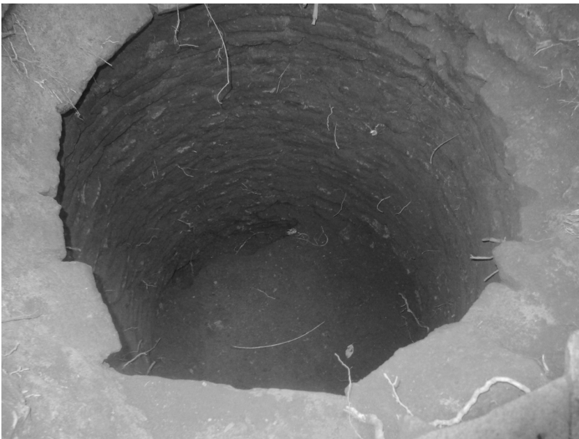
Figura 2: Estructura sanitaria (Pozo 1) durante el proceso de remoción de tierra

Como se mencionó, el descarte total de material en el Pozo 1 se encuentra conformado principalmente por material de construcción, en el que sobresalen restos de escombros y ladrillos (no contabilizados); y por otro lado, un alto porcentaje de fragmentos de vidrio, en particular del tipo plano, propio de ventanas, que representa un 89,4 % sobre el total hallado de este tipo de material. En menor proporción, casi un 7 %, se recuperaron fragmentos de botellas y frascos, cerca de un 3 % de vidrios grabados, posiblemente de aberturas tales como catedral, lustre azul, acanalado, y floreal borravino (Figura 2).