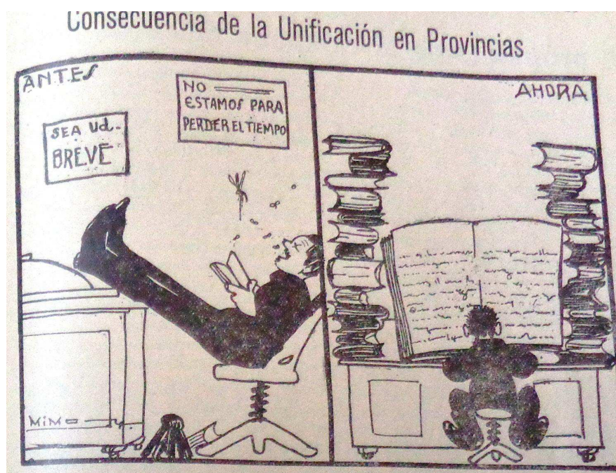
FIGURA 1 – Fuente: Ilustración Policial , Santiago de Chile, N° 39, octubre 1924