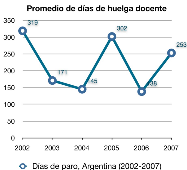
Gráfico 2. Promedio de días de huelga docente. Argentina (2002-2007)

Esta variable parece haber condicionado también los intentos de institucionalización de los espacios de negociación. Debe reconocerse la aparición en este período de un mayor número de espacios formales de participación de los actores sindicales, además de un grado relativamente mayor de institucionalización de la negociación promovida por la sanción de la Ley de Paritarias. Sin embargo, la persistencia de cierta discrecionalidad en las decisiones de las autoridades gubernamentales, y la decisión de continuar con medidas de fuerza durante períodos de discusión, reducen el efecto de dichas reglas formales sobre la interacción.