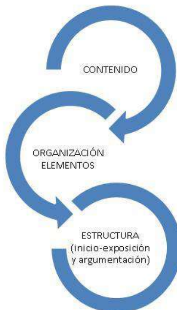
Figura 1: Dimensiones del discurso

Se puede destacar los siguientes elementos discursivos, que para este texto se entenderán como dimensiones del discurso: