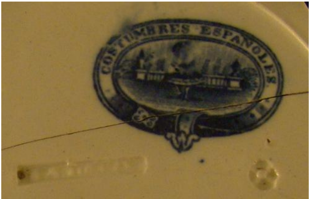
Figura 3b. Marca J. F. Wileman del plato anterior