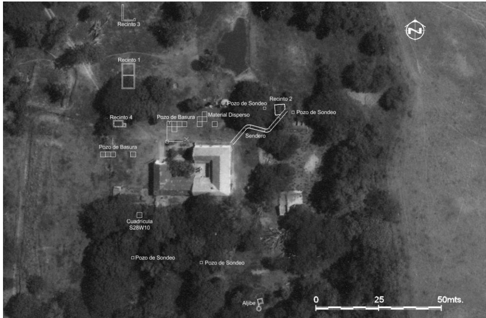
Figura 1. Ubicación áreas excavadas