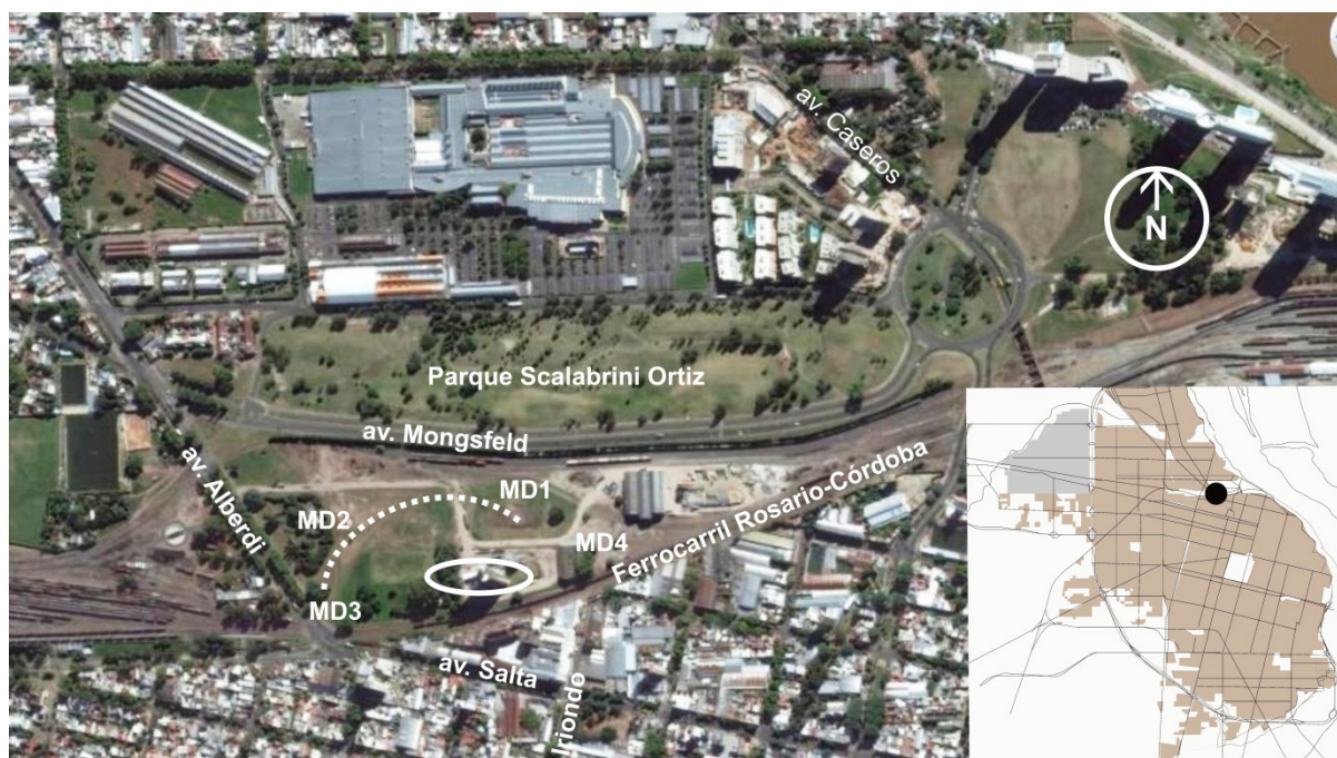
Figura 1. Ubicación general del sitio MD y los sub-sitios prospectados MD1, MD 2, MD3 y MD4. El óvalo alargado representa la laguna y el arco punteado indica aproximadamente el área de los fragmentos recolectados superficialmente entre 2017 y 2019.