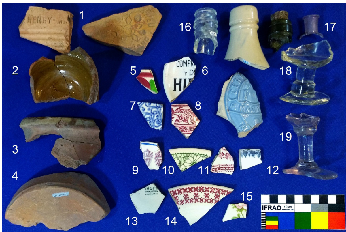
Figura 3. Fragmentos recuperados de MD. 1- Cerámica industrial. 2- Cerámica roja con vidriado. 3 y 4- Cerámica roja sin vidriado. 5- Cerámica floreal. 6- Plato publicitario. 7- Taza decorada flow blue. 8- Taza decorada por transferencia. 9- Plato decorado stamped. 10, 11 y 12- Tazas transferware c. 1920. 13 y 14- Lozas transferware industria argentina. 15- Taza decalware. 16- Picos de botellas de licor, cerveza “Magdelín” (c. 1878) y vino. 17- Pico de frasco de medicamento. 18 y 19- Copas domésticas y de bar.

suspendido por el cierre de la calle sobre el predio con un muro, lo que “encapsuló” el sitio. Los fragmentos, en primera instancia, se corresponderían cronológicamente a los años 1940 a 1990, aproximadamente lo que motivó considerarlo un sub sitio independiente.