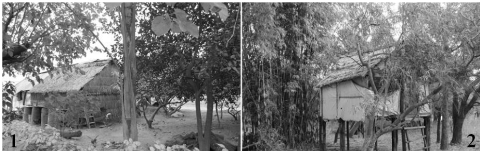
Figura 2. Paraje Cuatro Bocas

do de púas, cuyos postes de sostén se insertan en el mismo con una tupida vegetación. Se destacaba en el terreno la defensa, una construcción intencional paralela al camino, de casi un metro de alto y 0.70 m de ancho que bordea la costa, cuyo objetivo es levantar el nivel de terreno para impedir que en caso de inundación se afecte la Ruta Provincial Nro. 1. El lugar ha sido removido en un sector por las máquinas excavadoras que operaron durante la construcción de la defensa y del mantenimiento del camino de la costa por lo que el sitio se encuentra altamente perturbado.