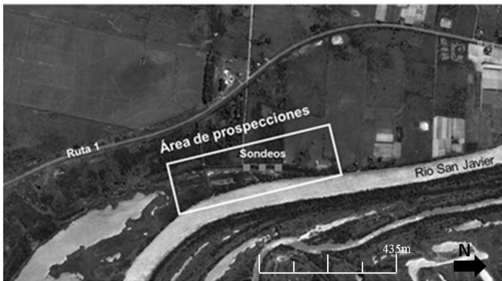
Figura 3. Paraje Cuatro Bocas. Área de prospecciones y sondeos

Se abrieron catas de sondeo en dirección norte-sur donde indicaron los vecinos que habrían hallado restos humanos “de soldados”. El resultado de estos elementos procedentes de los sondeos y prospecciones, determinó que el registro es compatible con un sitio arqueológico, denominado La Defensa cuya característica cerámica es asignable a Goya Malabrigo. Lo hallado no es vinculante con un regis-