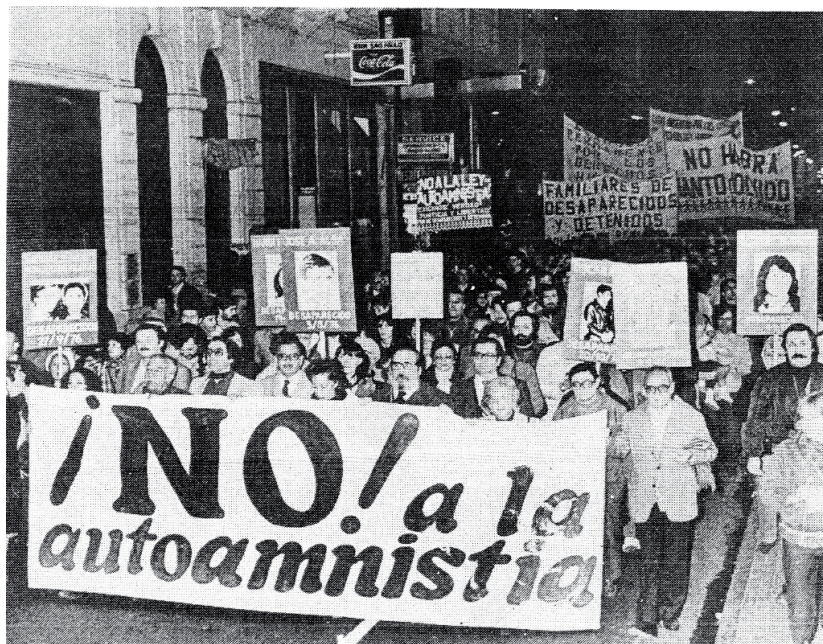
Diario Rosario, Rosario, 20 de agosto de 1983.