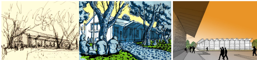
Fig.6- Lo analógico y lo digital como dos instancias gráficas instrumentales complementarias.

El empleo de herramientas graficas manipulables a la hora de proyectar mantienen una distancia conceptual frente aquellos procesos de producción virtual que caracterizan el ejercicio actual de la profesión. Lejos de pronunciarse en contra de la tecnología, la apropiación de la gráfica desde la percepción directa plantea un camino circular que contempla un acercamiento directo hacia la realidad a través de instrumentos gráficos manuales para luego alejarse y racionalizar a través del ordenador y poder nuevamente personalizar a través del dibujo a mano el producto de la máquina. La apropiación de la gráfica desde la percepción directa plantea un camino circular que se inicia con la gráfica manual, puede racionalizarse digitalmente y volver a personalizarse con la mano. El trabajo posterior en Taller, la post producción digital, alejada de la gráfica comercial, hace posible la conjunción de dos instancias gráficas instrumentales diferentes.