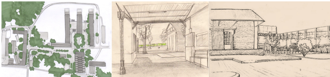
Fig 1. Dibujos de alumnos EG1: Observación intencionada, las miradas posibles en el espacio colectivo.

La plaza deriva del vacío “residual” de un sistema proyectual que plasma el pensamiento de una época y que adquiere cualidades colectivas en el tiempo, al aglutinar un patrón de coreografías peatonales y vehiculares que se graban en el sitio a través tensiones y en la memoria colectiva a través de recuerdos. En la terraza que vincula las facultades de Arquitectura y Ciencias Políticas la experiencia es múltiple: espacio para la diversidad, el intercambio, la reunión. Una fuerte tensión longitudinal que culmina en dos grandes espacios articulados en ambos extremos de escala importante donde se encuentra el bar y se realizan actos, elecciones, convenciones, y se abren uno hacia el campo de deportes y el otro al sur hacia la costa, puerto, silos, muelles, depósitos, y los nuevos edificios del Centro