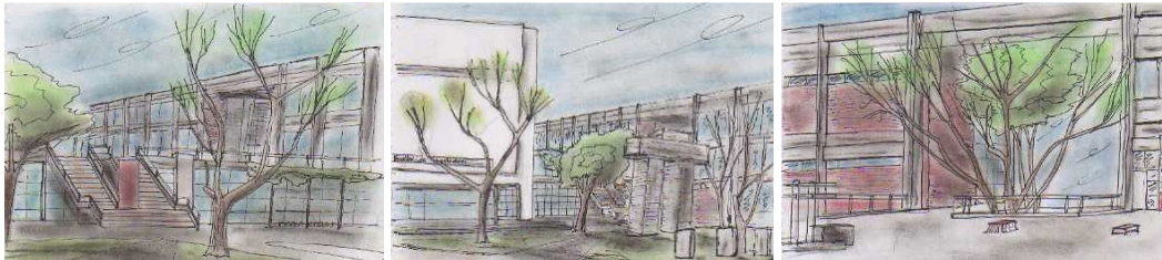
Fig.2: Dibujos de alumnos EG1–Secuencia de recorrido: Mirada diagonal plaza, escaleras y terraza.

El registro interactúa con la memoria, aparece la “resonancia”, la vinculación con sus experiencias anteriores; esto permite la perdurabilidad de lo institucional como lugar común, de coexistencia. En este mismo sentido, un espacio con una fuerte estructura colectiva como el C.U.R involucra un compromiso con su sedimento cultural.