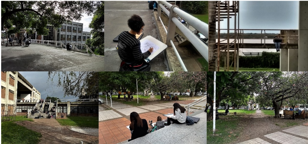
Fig.3- La capacidad de situarse para mirar conlleva la comprensión del espacio observado.

“No padecemos de falta de imágenes, sino de una inundación de imágenes. El ojo tiene antes que pertrecharse, disponerse, ponerse en situación de poder aún discernir y leer. Así es que no se trata de un alegato en pro del uso de los sentidos, sino de cómo se los puede agudizar para la percepción histórica”. (Schlögel, 2007).